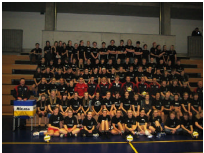
Mynd tekin að loknum hæfileikabúðum BLÍ

Yngriflokkanefndin vill þakka þeim sem stóðu að búðunum sérstaklega fyrir góð störf í þágu hreyfingarinnar. Krakkarnir fengu hrós fyrir góða umgengni í íþróttahúsinu og var stjórnin í mötuneytinu einnig ánægð með hegðunina í matsalnum.