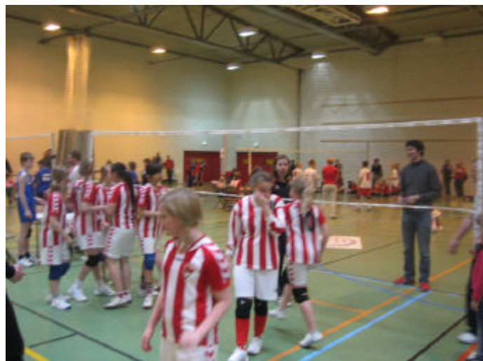
Myndin er tekin á yngriflokkamóti í Mosfellsbæ, apríl 2008.